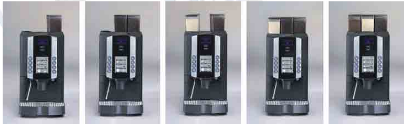
研磨咖啡 x 1G (標準機型)

共可放 3 槽：咖啡豆槽 650g x 1 (或雙槽 2G) + 粉料槽 2L x 1 (或雙槽 2P)